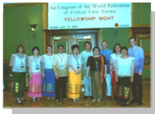
WFCCN Council in Filipiniana Attire

El programa social promovió la camaradería y destacó la cultura Filipina representada por su música y sus danzas.