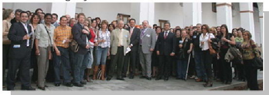
Delegados del Congreso

En esta reunión organizaciones de enfermería de Argentina (AEECRA), Perú (ASPEED), y Portugal se unieron como organizaciones miembros. Representantes individuales de Colombia, Venezuela, Chile, Panamá, Costa Rica, República Dominicana, Ecuador y Guatemala están trabajando para constituir un grupo. Asistieron más de 1000 enfermeros de España, México, Brasil, Perú, Panamá, El Salvador, Costa Rica, Argentina, Colombia, EEUU, Portugal y Canadá.