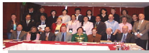
Reunión Conjunta de los consejos de la WFSICCM y la WFCCN