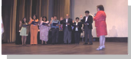
Oath to Office of the New Officers and members of FLECI

El lanzamiento de la FLECI y el juramento de oficio del Consejo Administrativo y los Representantes se llevó a cabo el 26 de noviembre de 2006.