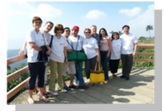
Miembros del Consejo fueron llevados de turismo al Taal Volcano en Tagaytay, Cavite