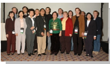
Consejo de Representantes de la WFCCN

Founding Members Council Members Individual Members